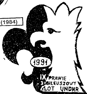
Plakietka z IX Złotu (1991)