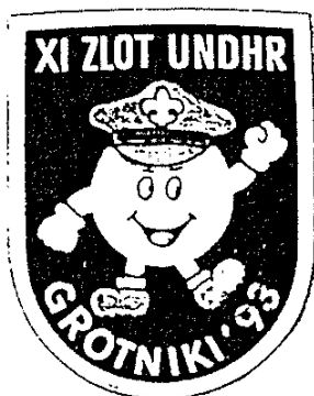
Plakietka z XI Złotu (1993)