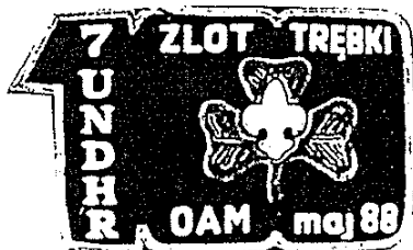
Plakietka z VII Złotu (1988)