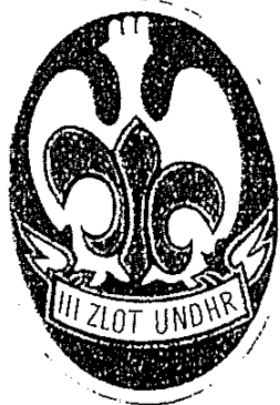
Plakietka z III Złotu (1984)

Oto wybrane plakietki (i jeden znaczek) z kilku Złotów UNDHR. Najstarsza plakietka pochodzi z roku 1984 i towarzyszyła III Złotowi, zorganizowanemu przez 16 WDH w Puszczy Bolimowskiej.