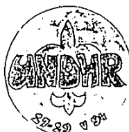
Znaczek z XII Złotu (1994)